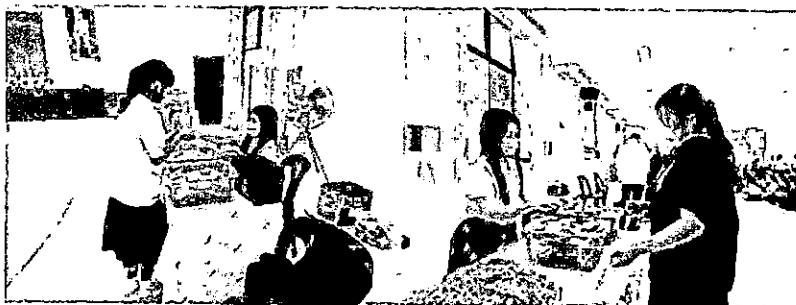
ภาพการจ่ายยาเสริมธาตุเหล็กกรดโฟลิก และแจกอาหารว่างกับเครื่องดื่ม ให้แก่ นักเรียนหญิงโรงเรียนปางศิขณน้อยพิทยาคมที่เข้าร่วมโครงการ