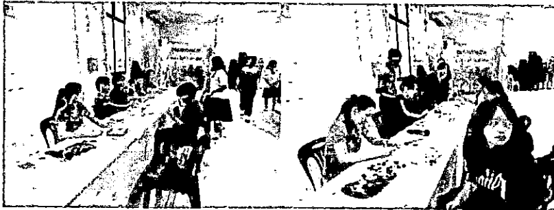
ภาพการลงทะเบียนเข้าร่วมโครงการ