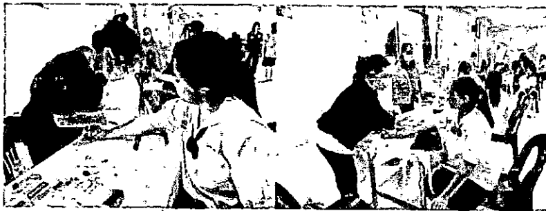
ภาพการเจาะเลือดเพื่อตรวจคัดกรองภาวะโลหิตจางจากการขาดธาตุเหล็ก โดยเจ้าหน้าที่จากโรงพยาบาลปางศิขณน้อย